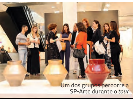
Um dos grupos percorre a SP-Arte durante o tour