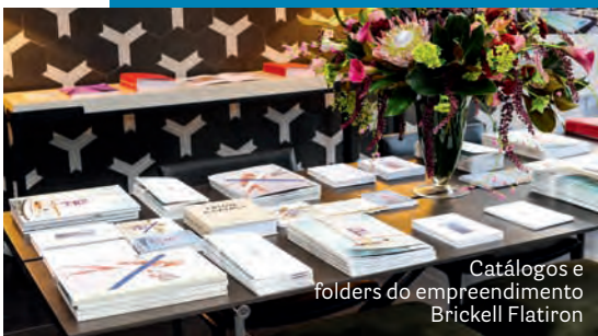
Catálogos e folders do empreendimento Brickell Flatiron

Artistas, designers, lojistas e investidores compareceram à celebração arquitetônica e artística em torno do empreendimento residencial Brickell Flatiron, localizado em downtown Miami, realizada no lounge Casa Vogue 40 Anos. O condomínio high class , de 65 andares, tem áreas comuns assinadas por Julian Schnabel